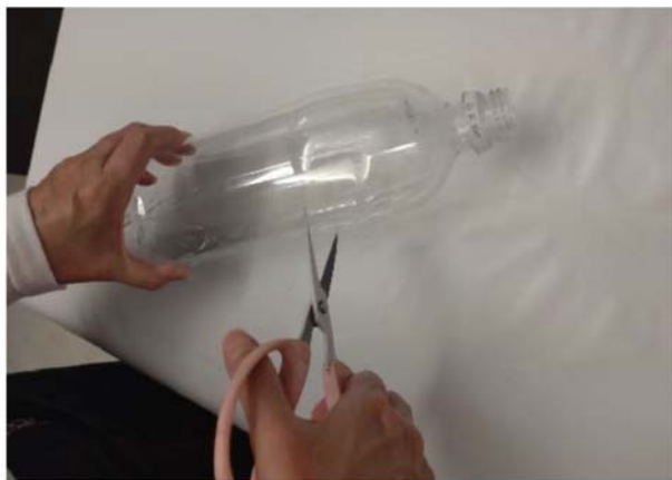
1、ペットボトルカット