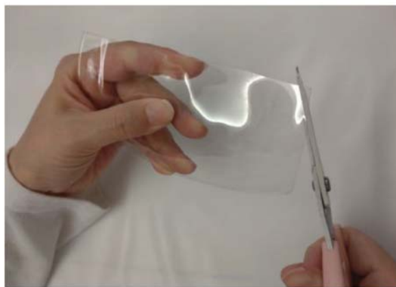
5、四隅の角を丸くカット